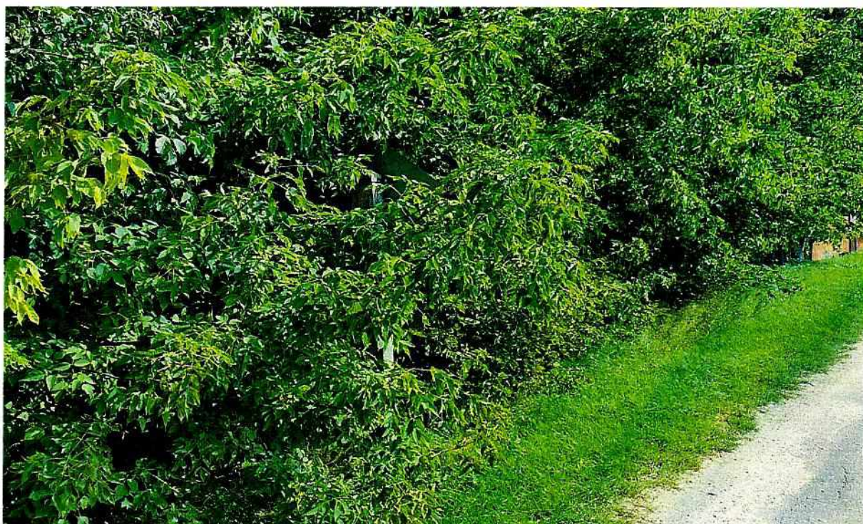
Znak drogowy – poniżej ten sam.